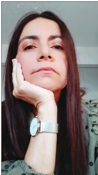
Θα ήθελα τα παιδιά που βίωσαν δύσκολα γεγονότα στη ζωή τους να μπορούν να «δουν» τον εαυτό τους μέσα σε βιβλία, να έχουν εκπροσώπηση στη λογοτεχνία

Πρωταγωνίστρια του βιβλίου είναι η δεκαεξάχρονη Αμαλία, η οποία σε πρωτοπόροση αφήγηση και χωρίς να ακολουθεί γραμμική πορεία εξιστορεί τη ζωή της από παιδί ως σήμερα. Μέσα από την αφήγηση μαθαίνουμε πως το κορίτσι κακοποιήθηκε σεξουαλικά όταν ήταν οκτώ ετών από τον σύντροφο της μητέρας της. Φανερό είναι το ψυχικό τραύμα που κουβαλά και που διαμορφώνει τη ζωή της από τη μέρα της κακοποίησης και έπειτα. Έγραφα το βιβλίο για να δείξω πόσο βαθύ είναι το ψυχικό τραύμα της σεξουαλικής κακοποίησης και πως τα θύματα χρειάζονται την απόλυτη κατανόηση της κοινωνίας και της